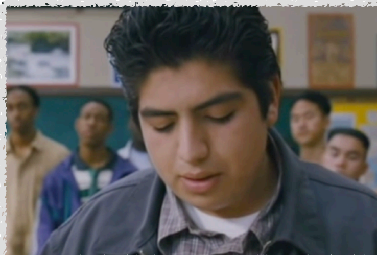
Freedom Writers (2007)