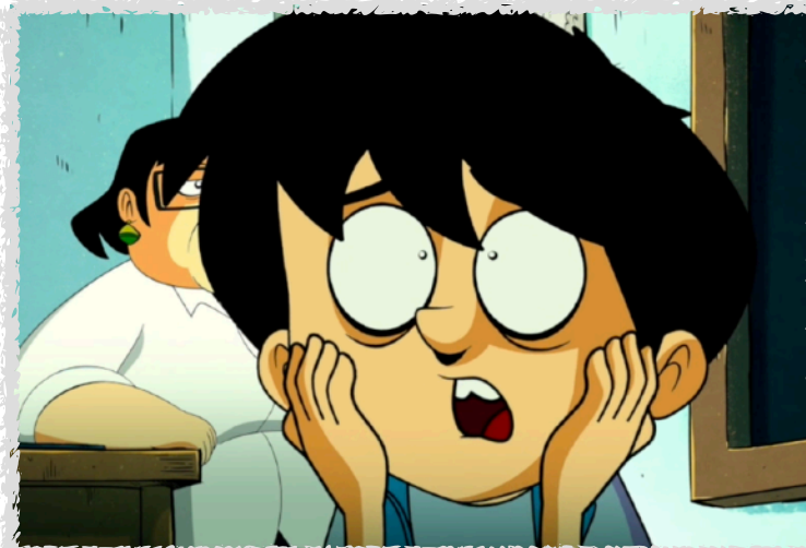
Zero Calcare strappare lungo i bordi (2021)