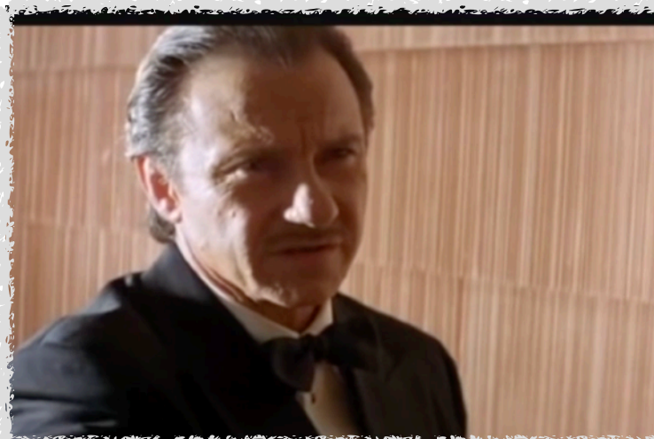
Pulp Fiction Mister Wolf risolvo problemi (1994)