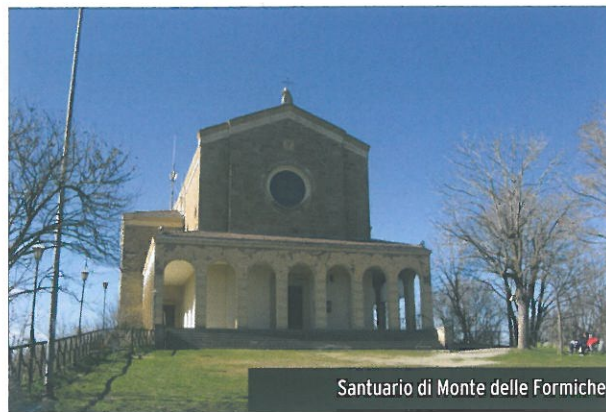
Santuario di Monte delle Formiche

alle comunità cristiane che sorgono attorno ai Santuari e consentire ai tanti camminatori un percorso per incontrare il Mistero che ha toccato quei luoghi rendendosi visibile attraverso Maria.