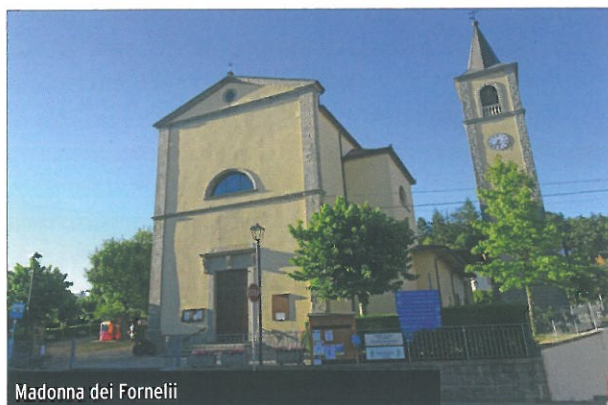
Madonna dei Fornelli

Ecco un avvocato, un sindaco e un prete. Non è l’inizio di una barzelletta, ma la nascita della Via Mater Dei . Da allora, infatti, si è messo in moto un lavoro incredibile nel quale sono state coinvolte tante persone: istituzioni, appassionati di trekking... È nato un cammino con l’ambizione di collegare 10 santuari tra cui Madonna delle Formiche, Boccadirio, Montovolo. Non è stato difficile scegliere il nome – Via Mater Dei – perché volevamo da un lato distinguerci dalla più nota Via degli dei, dall’altro indicare una possibile complicità con essa. Nel frattempo, si è costituita l’Associazione Via Mater Dei con lo scopo di valorizzare il cammino e renderlo davvero un luogo importante per lo sviluppo delle piccole comunità montane, per dare coraggio